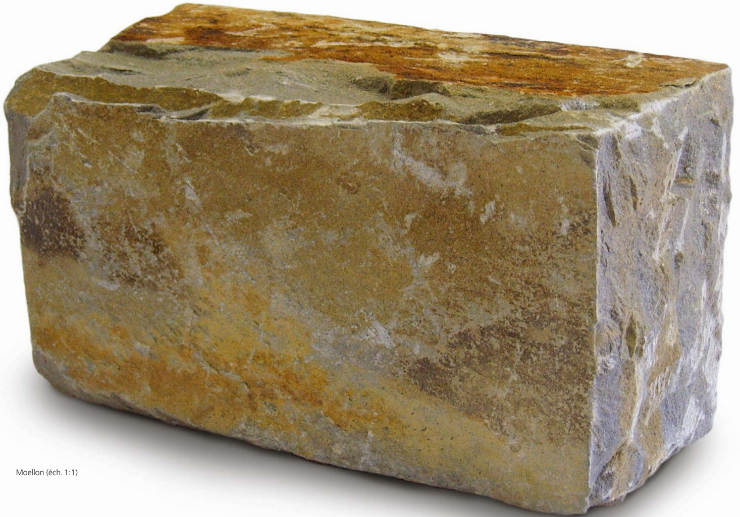
Moellon (éch. 1:1)